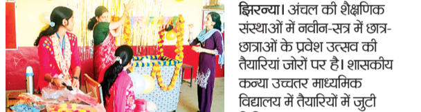
झिरव्या। अंचल की शैक्षणिक संस्थाओं में नवीन-रत्न में छात्र-छात्राओं के प्रवेश उत्सव की तैयारियां जोरों पर हैं। शासकीय कन्या उच्चतर माध्यमिक विद्यालय में तैयारियों में जुटी शिक्षिकाएं।